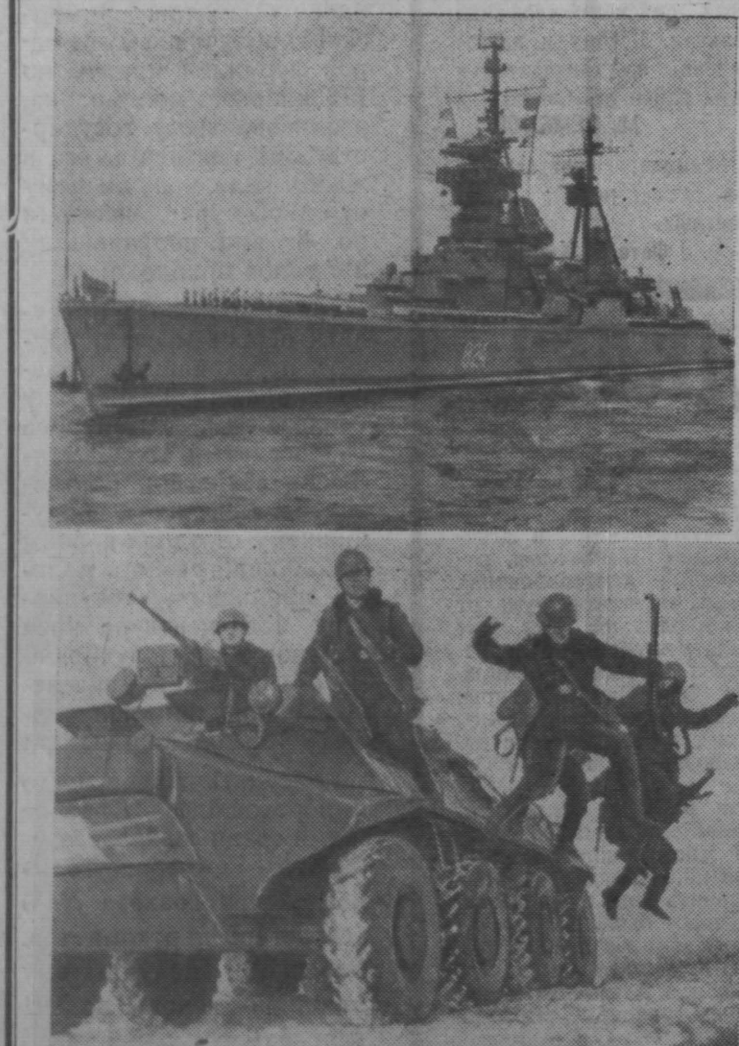
Краснознаменный Тихоокеанский Флот. Крейсер «Дмитрий Пожарский».

Вторых, семинарские занятия проводятся, как правило, раз в месяц. Значит, ограничивать их полутора часами, как получилось у Ильинцев, тоже неверно.