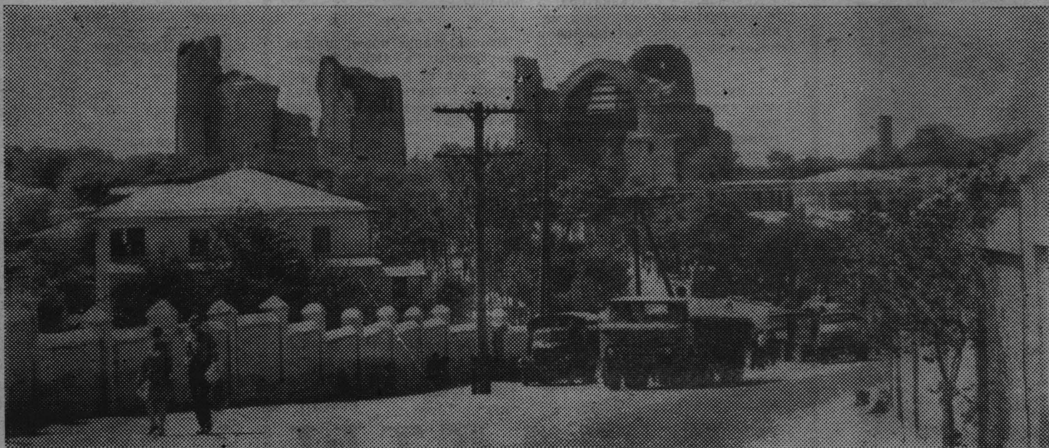
По городам Советского Союза. Самарканд. Мечеть Биби-Ханым.

ГАЗЕТА ВЫХОДИТ ВО ВТОРНИК, ЧЕТВЕРГ, СУББОТУ.