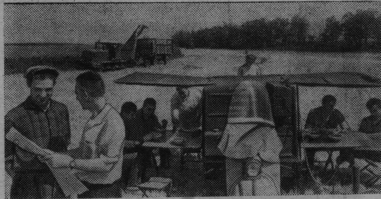
Ростовская область. В Азовском районе проявляют большую заботу о культурно-бытовом обслуживании хлеборобов во время полевых работ.

Мы призываем всех работников культурно-просветительных учреждений района включиться в социалистическое соревнование работников культуры и искусства Кузбасса в честь 100-летия со дня рождения В. И. Ленина.