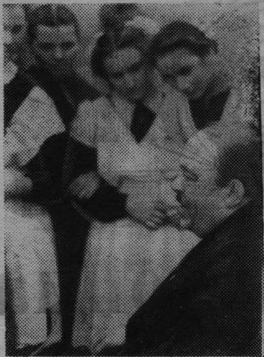
18 января исполняется 70 лет со дня рождения Александра Ильича Безыменского. Произведениями 20-х годов, посвя-