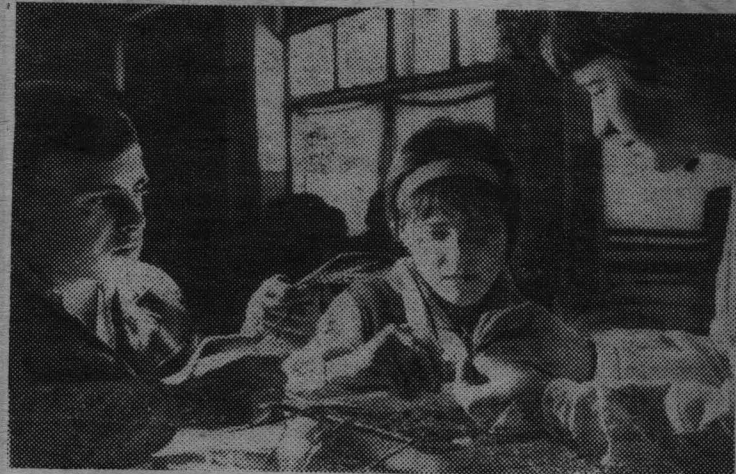
РУМЫНИЯ. Учащиеся сельскохозяйственной школы города Фундуля на практических занятиях.