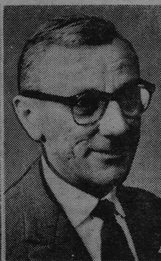
Жан Эффель (Франсуа Лежен) — художник, общественный деятель (Франция).