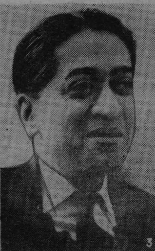
Ромеш Чандра — генеральный секретарь Совета Мира (Индия).