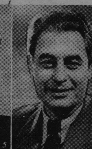
Йорис Ивенс — кино-режиссер, общественный деятель (Нидерланды).