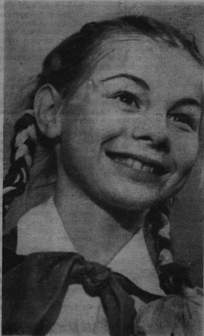
Меня приняли в пионеры!

терина Тимофеевна часто ходит с детьми на прогулки, в кино, на экскурсии. Мы, родители, очень благодарны за ее чуткое отношение к детям. А. ЖАРИКОВ, рабочий совхоза.