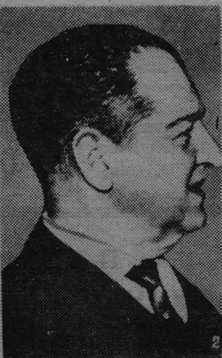
Хорхе Саламеа Борда — писатель, общественный деятель (Колумбия).