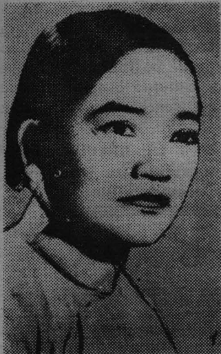
Нгуен Тхи Динь — общественная и политическая деятельница (Южный Вьетнам).