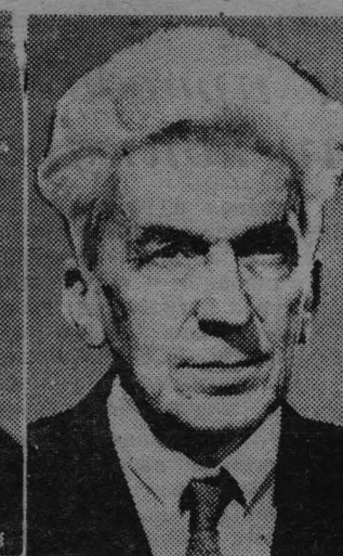
Эндре Шик — ученый, общественный деятель (Венгерская Республика).