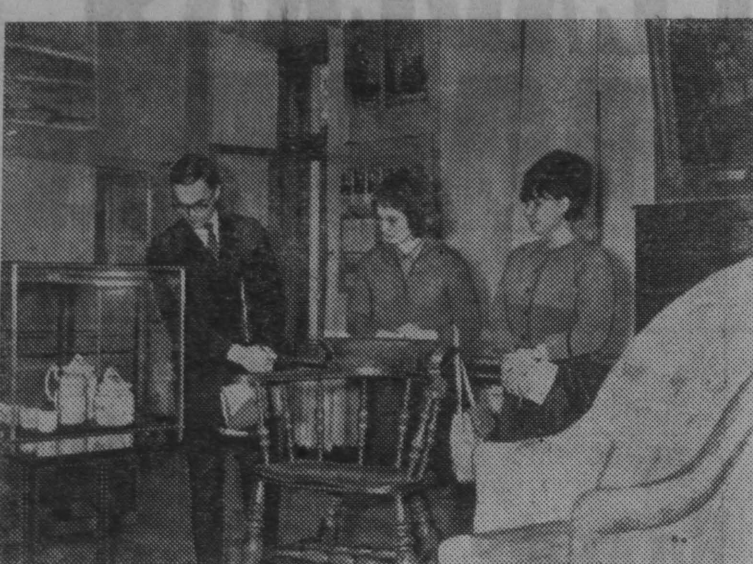
На снимке: посетители музея Карла Маркса и Энгельса осматривают вещи, принадлежавшие Карлу Марксу.

Огромное внимание Маркс и Энгельс уделяли изучению экономического строя современного капиталистического общества. Маркс посвятил этому главный