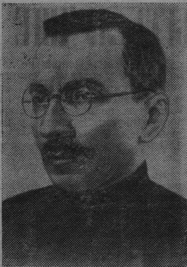
Имя выдающегося советского педагога и талантливого писателя Антона Семеновича Макаренко