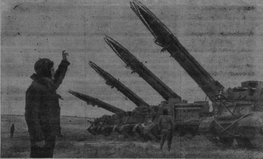
Обратные тактические ракеты—грозное оружие сухопутных войск. В боевую готовность они могут быть приведены за несколько минут.

Великий Ленин неоднократно подчеркивал, что к защите Отечества, к защите социалистической Советской Республики надо готовиться серьезно, напряженно, неуклонно. Верные ленинским заветам, наша партия и правительство, весь советский народ считают своей важнейшей заботой укрепление обороноспособности страны, оснащение ее Вооруженных Сил всем необходимым для отражения возможной агрессии империализма.