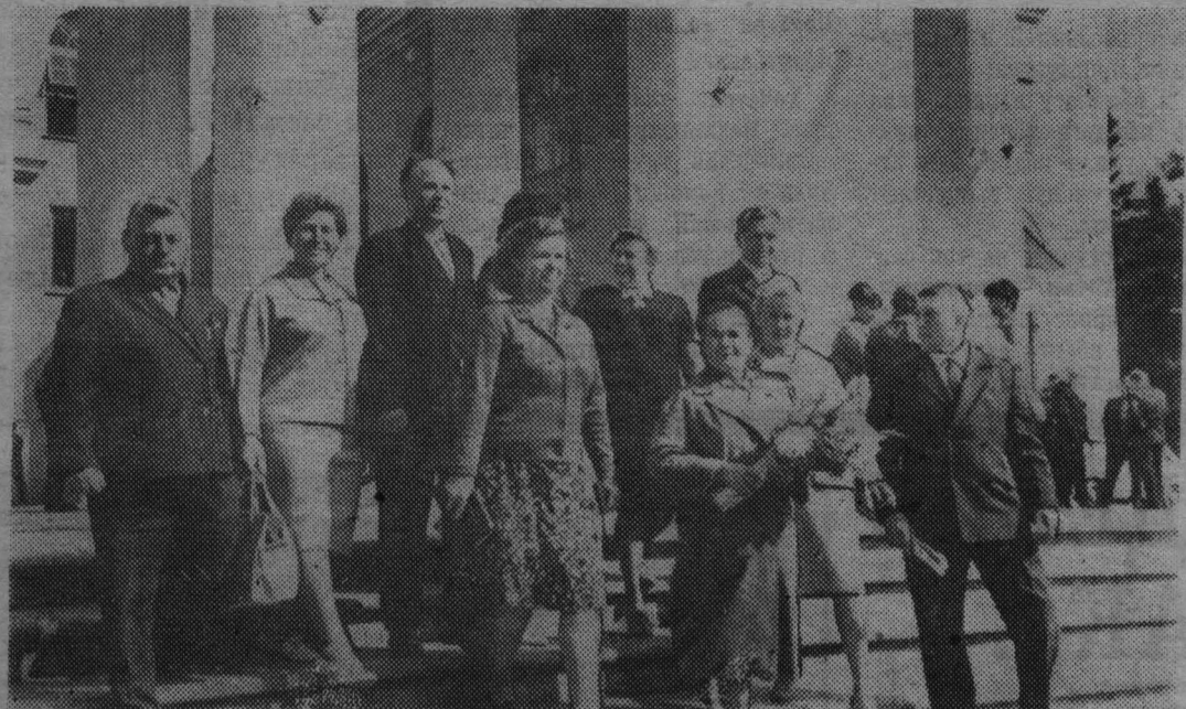
Группа передовых учителей нашего района.