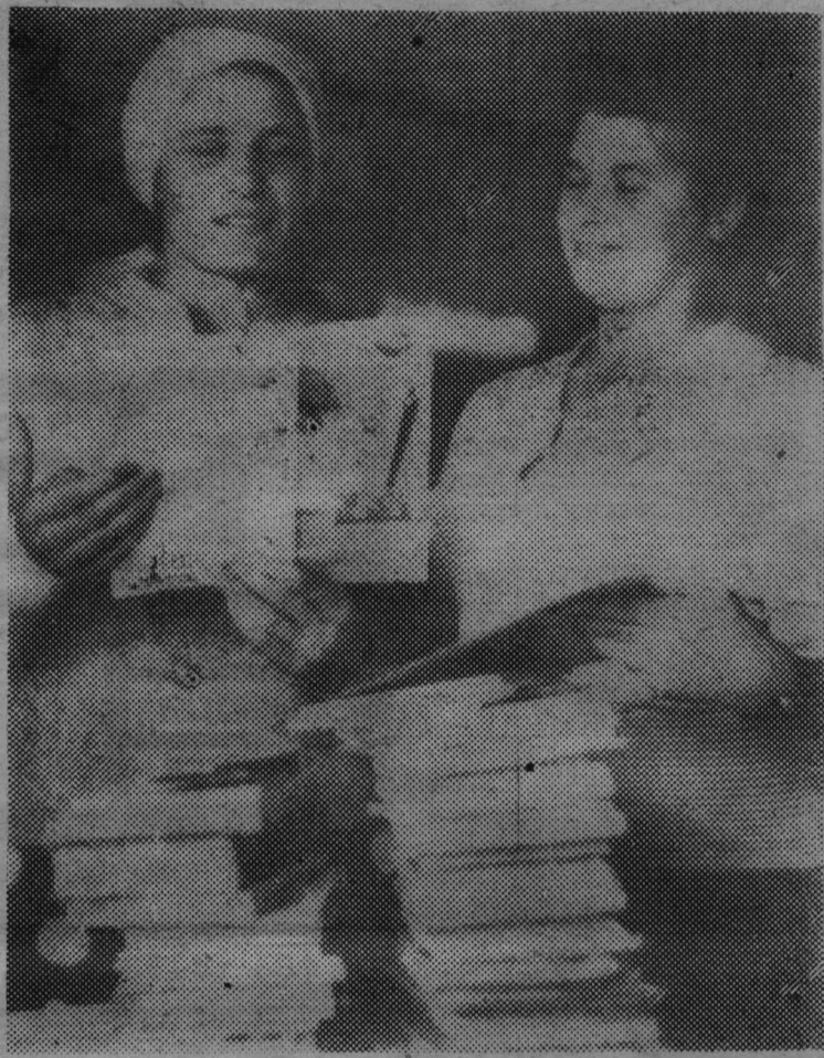
ЧЕЛОВЕК И ЕГО ДЕЛО