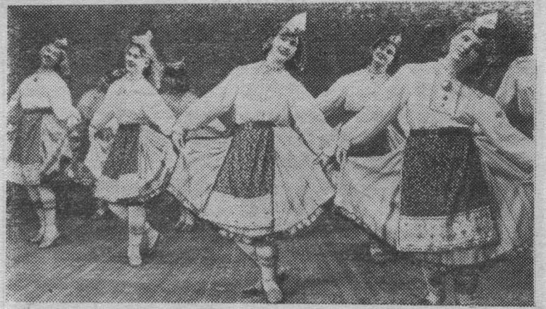
Таллин. Дворец культуры имени Я. Томпа. На снимке: женский ансамбль народного танца «Куллакеграйд» репетирует «Танец молодых рыбаков».