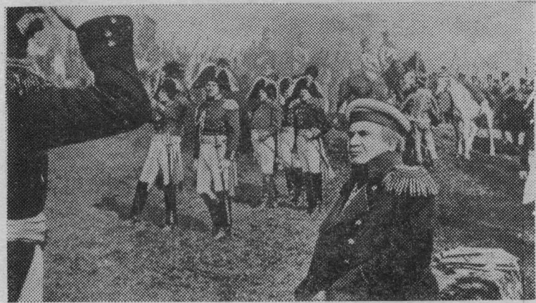
Кадр из кинофильма «Война и мир» (3-я серия «1812 год»). В роли Кутузова — артист Борис Захава. Производство киностудии «Мосфильм». Режиссер-постановщик Сергей Бондарчук.