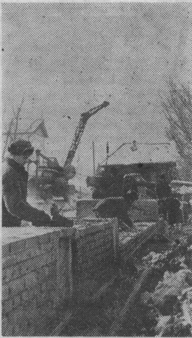
Здесь будет 24-квартирный дом

Большое строительство развернуто в совхозе «Садопарковый». Чтобы обеспечить объекты пиломатериалом, надо много леса. Заготовлено 1600 кубометров, 900 кубо-