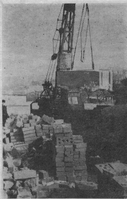
На помощь совхозу со своей строительной техникой пришли шефы из города.

Велик объем работ. Своими силами совхозу трудно было бы справиться. Строительная бригада насчитывает лишь 25 человек, которая не имеет мощной техники, нужной для сооружения современных зданий. На помощь приходят шефы из города. Управление «Фундаментстрой» треста «Кузнецкжилстрой» ведет работы на тепличном комбинате, а учащиеся из ПТУ-10, которых вы видите на снимках, помогают сооружать 24-квартирный жилой дом.