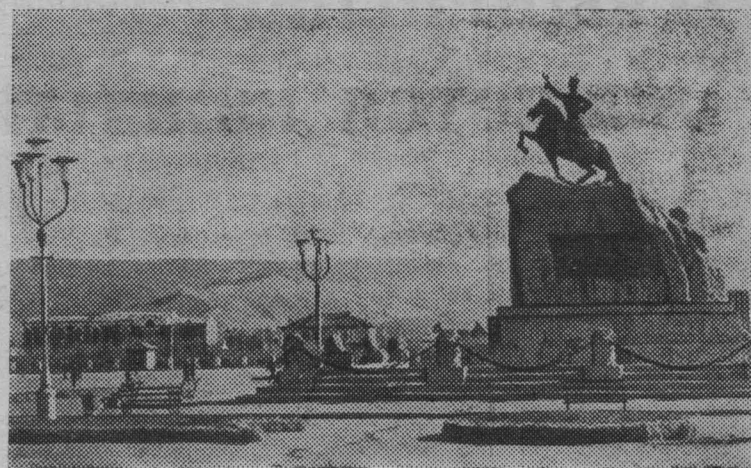
Улан-Батор сегодня. Памятник национальному герою Монголии Сухэ-Батору.