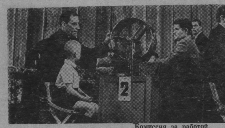
Комиссия за работой.