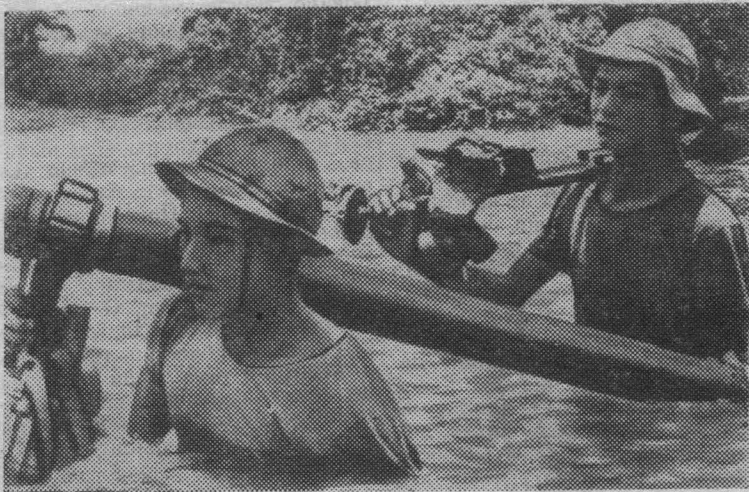
ЮЖНЫЙ ВЬЕТНАМ. Воины армии Освобождения преодолевают водную преграду.