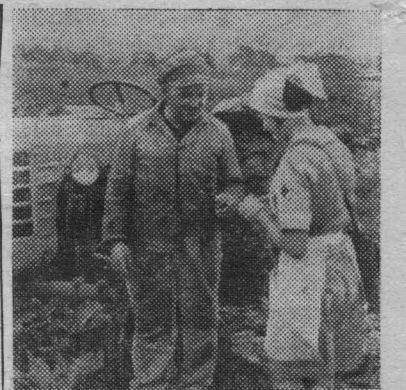
ПОЛЬША. Медицинская сестра оказывает трактористу первую помощь.