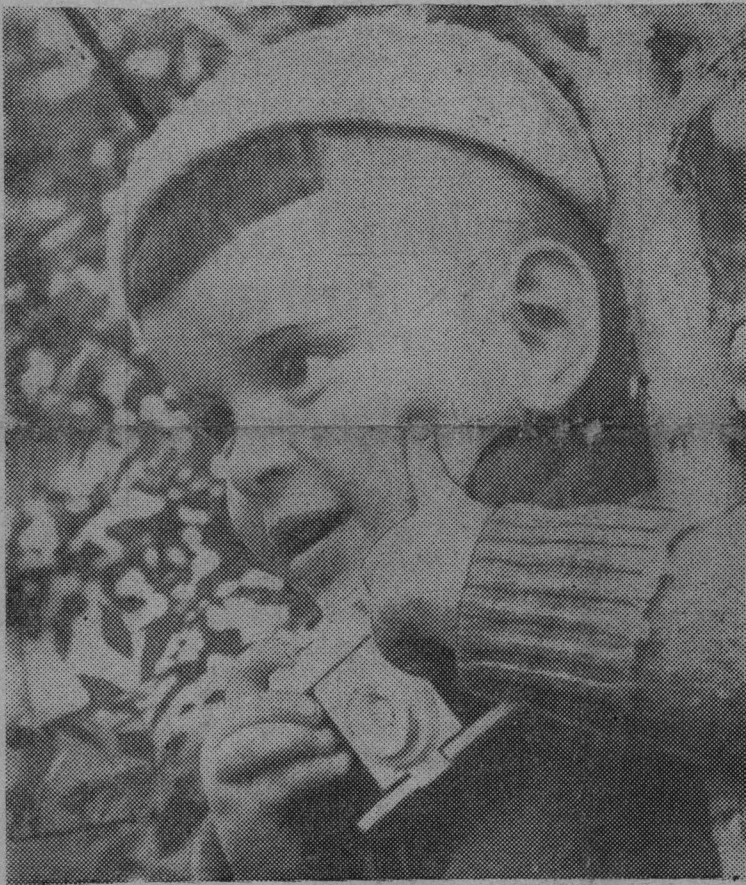
Что же снять еще?