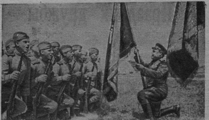
На снимке: воины у боевого знамени дают клятву биться с врагом до полной победы.