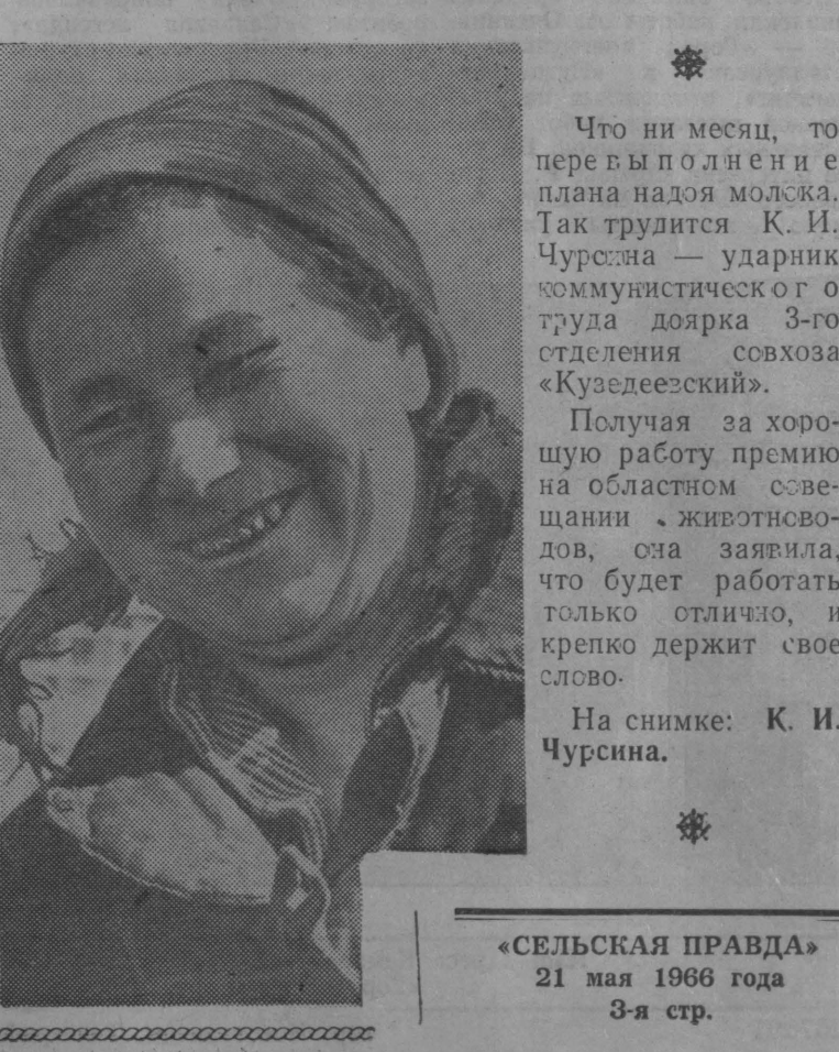
«СЕЛЬСКАЯ ПРАВДА» 21 мая 1966 года 3-я стр.