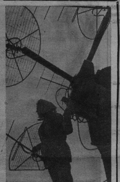
В Москве открыта фотовыставка «ТАСС-65». Это творческий отчет фотожурналистов Телеграфного агентства Советского Союза за минувший год. Творческий отчет фотожурналистов ТАСС посвящается XXIII съезду КПСС. Вот фотоснимок, представленный на выставке. Р. Дик. «Чуткие антенны».

заместитель председателя месткома второго отделения совхоза «Сидоровский».