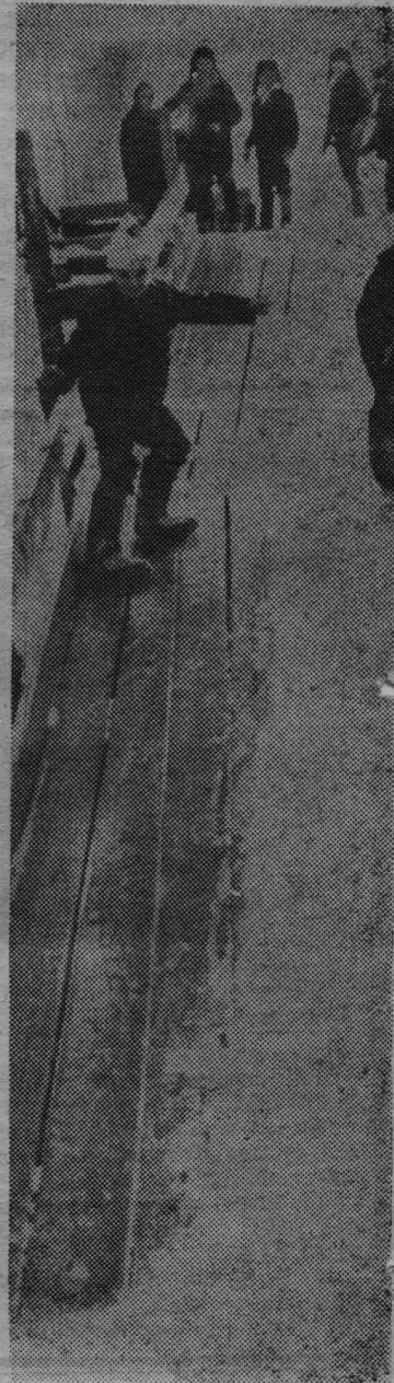
Последние зимние забавы.