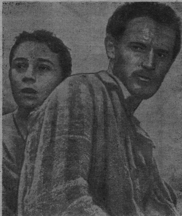
Кадр из фильма «Альпийская баллада»