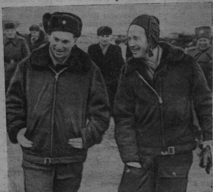
Космонавты Павел Иванович Беляев и Алексей Архипович Леонов после приземления.