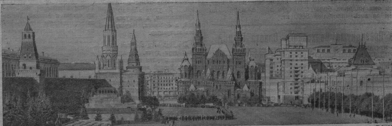
МОСКВА. Кремль. Красная площадь.