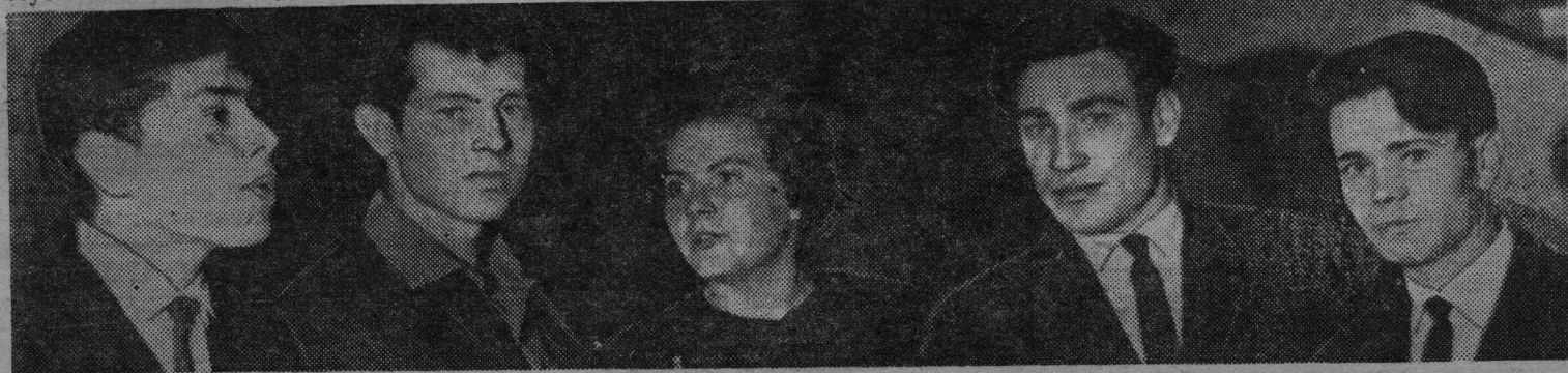
Делегация Кузнецовского куста — победительница музыкального конкурса.