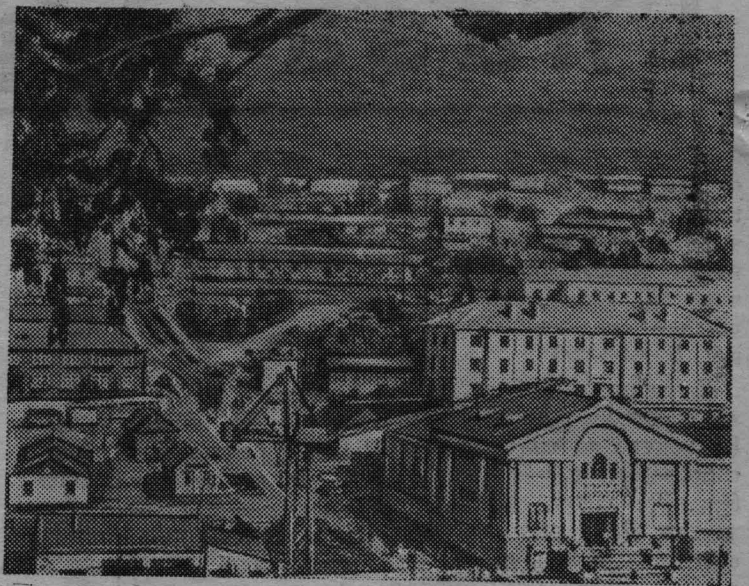
На снимке: вид на город с Никольской сопки. На переднем плане — кинотеатр «Камчатка».