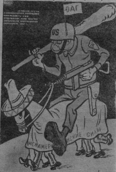
Агитплакат художника Бор. Ефимова, стихи А. Жарова.

«Агрессию против Доминиканской республики империалисты США прикрывают ныне флагом Организации американских государств (ОАГ)».