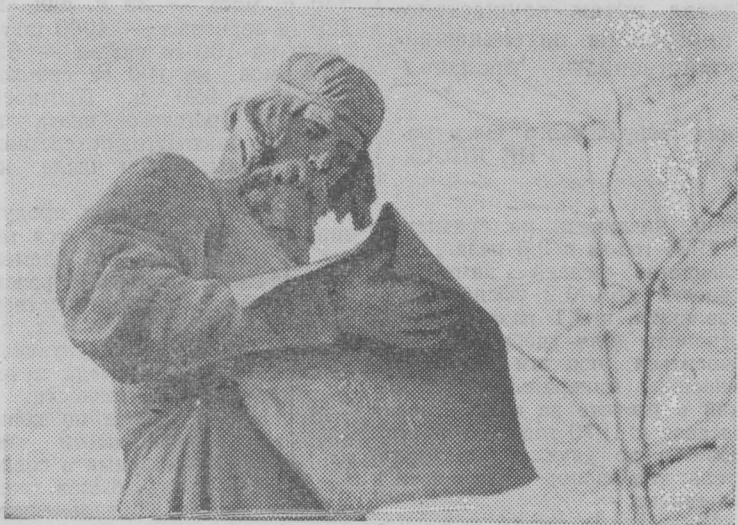
МОСКВА. Памятник первопечатнику Ивану Федорову.