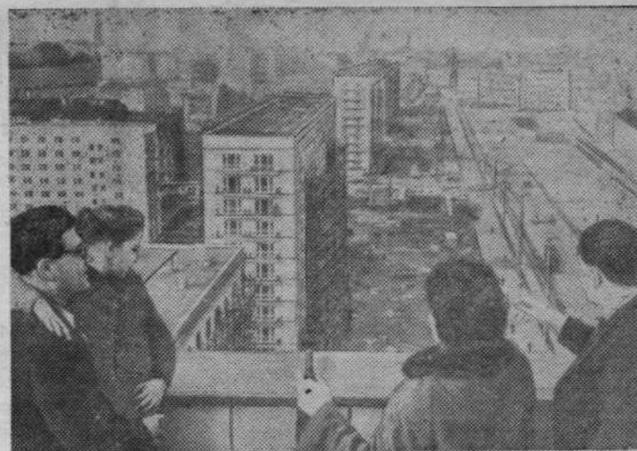
ГЕРМАНСКАЯ ДЕМОКРАТИЧЕСКАЯ РЕСПУБЛИКА. Вид на новостройки Карл-Маркс-алее в Берлине.