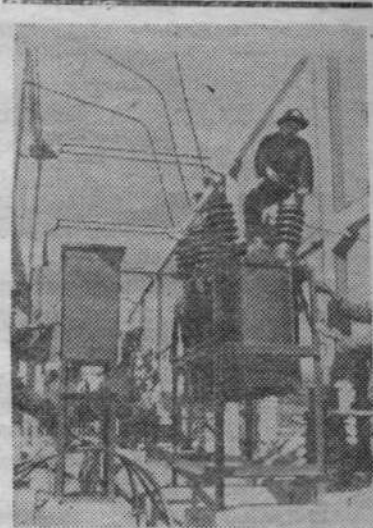
Монтаж оборудования на электростанции в Кам Фа (ДРВ).