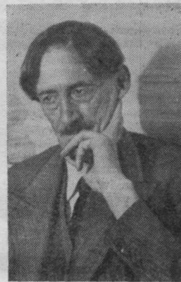
АНРИ БАРБЮС — французский писатель (1873—1935).

Поистине огромна работа Барбюса в защиту мира, в сплочении сил народного фронта против фашизма и войны, списавшая ему горячую любовь миллионов людей во всех частях света. С его именем связана организация всемирных антифашистских конгрессов, слетов, обществ, митингов за освобождение политических заключенных из гитлеровских застенков. Гневные слова Барбюса по