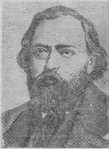
Огарев Николай Платонович — выдающийся русский революционный демократ, поэт и публицист.

Вместе с Герценом активно боролся он за полное уничтожение помещичьего землевладе-