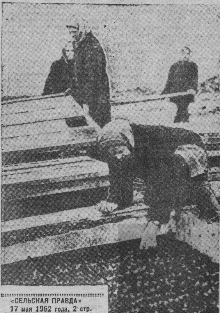
«СЕЛЬСКАЯ ПРАВДА» 17 мая 1962 года, 2 стр.