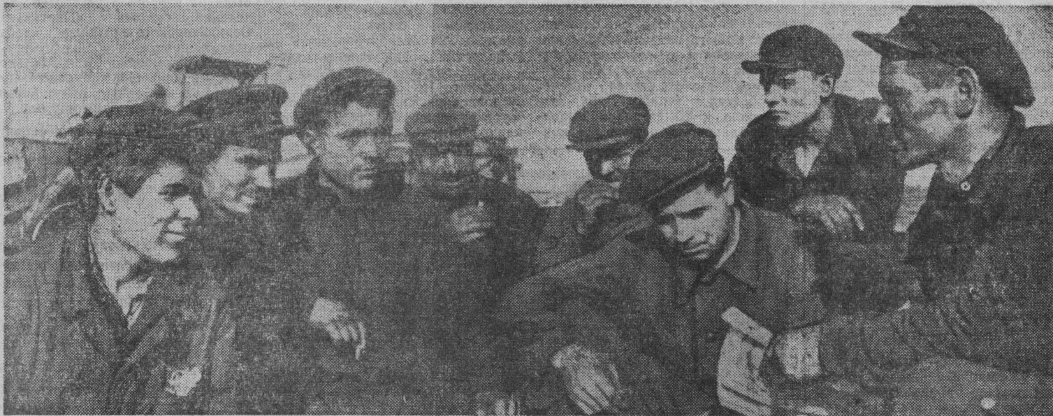
«СЕЛЬСКАЯ ПРАВДА» 13 сентября 1962 года. 2 стр.

ДУШАНБЕ. Хлопкоочистительные предприятия Таджикистана приступили к переработке хлопка-сырца нового урожая. Впервые в нынешнем году на хлопкоочистительных заводах будут применены волокоочистительные машины, изготовленные Душанбинским механическим заводом имени Орджоникидзе.