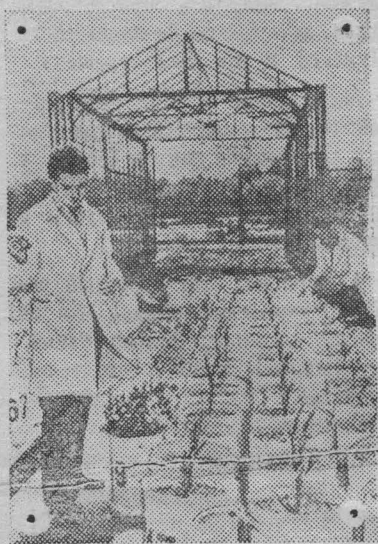
Огромных успехов достигла наука в Румынской Народной Республике. Научно-исследовательские учреждения ведут большую работу по оказанию практической помощи промышленности, транспорту и сельскому хозяйству.

НА СНИМКЕ: в лаборатории Бухарестского научно-исследовательского института технических культур. Здесь разрабатывают методы борьбы с засухой на кукурузных плантациях.