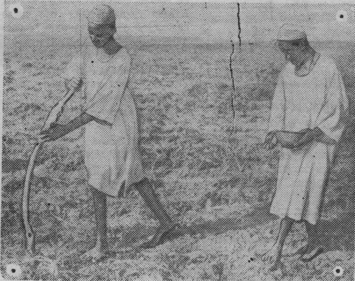
В Судане таким примитивным способом производится сев — посредством простой палки «селуки». Ею делают углубления в земле, а затем бросают в них семена.