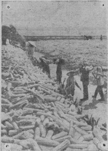
Богатый урожай кукурузы вырастили крестьяне уезда Шаньси недалеко от столицы Китайской Народной Республики Пекина.