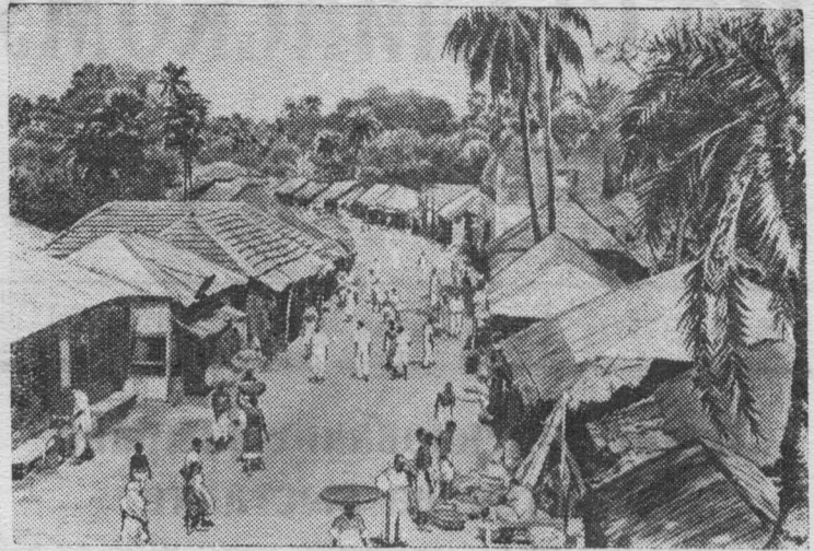
Индия. Торговая улица большой деревни в Западной Бенгалии. Деревня расположена на шоссе, ведущем из Калькутты в штат Бихар.

Намечены конкретные меры для улучшения работы пункта.