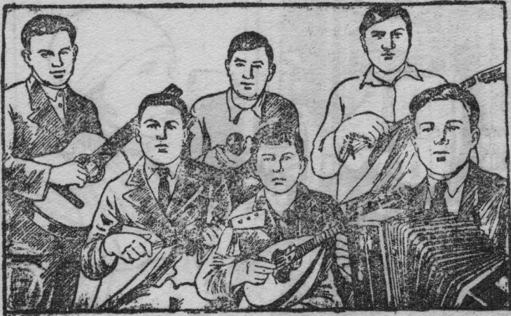
НА СНИМКЕ: Струнный оркестр клуба колхоза „Степан Разин“ Купинского района.