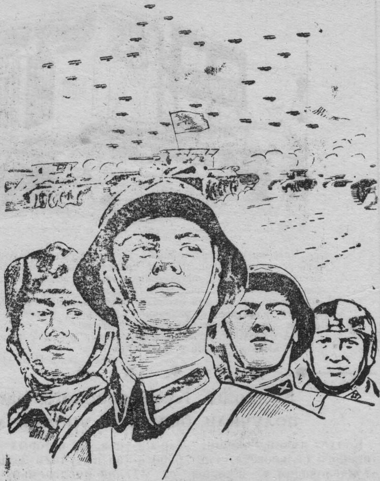
Воинская служба в Рабоче-Крестьянской Красной Армии представляет почетную обязанность граждан СССР.

НА СНИМКЕ: Плакат художника К. Климашина, выпущенный издательством «Искусство».