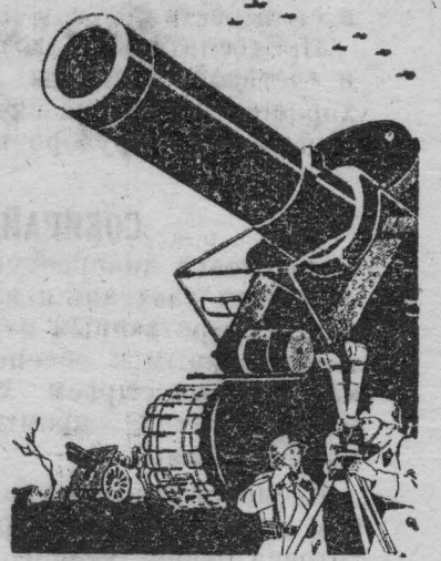
НА СНИМКЕ: Новый плакат работы художников Дени и Долгорукова, выпущенный Государственным военным издательством Народного Комиссариата Оборона СССР.