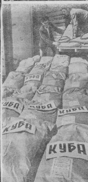
ДАГЕСТАНСКАЯ АССР. Работники сельского хозяйства республики выполняют почетный заказ: готовят для отправки трудящимся героической Кубы большое количество кукурузы. В адрес далеких друзей уже отгружено свыше двух тысяч тонн высокосортного кукурузного зерна.

На снимке: подготовка кукурузы для Кубы на Хасавюртовском комбикормовом комбинате.