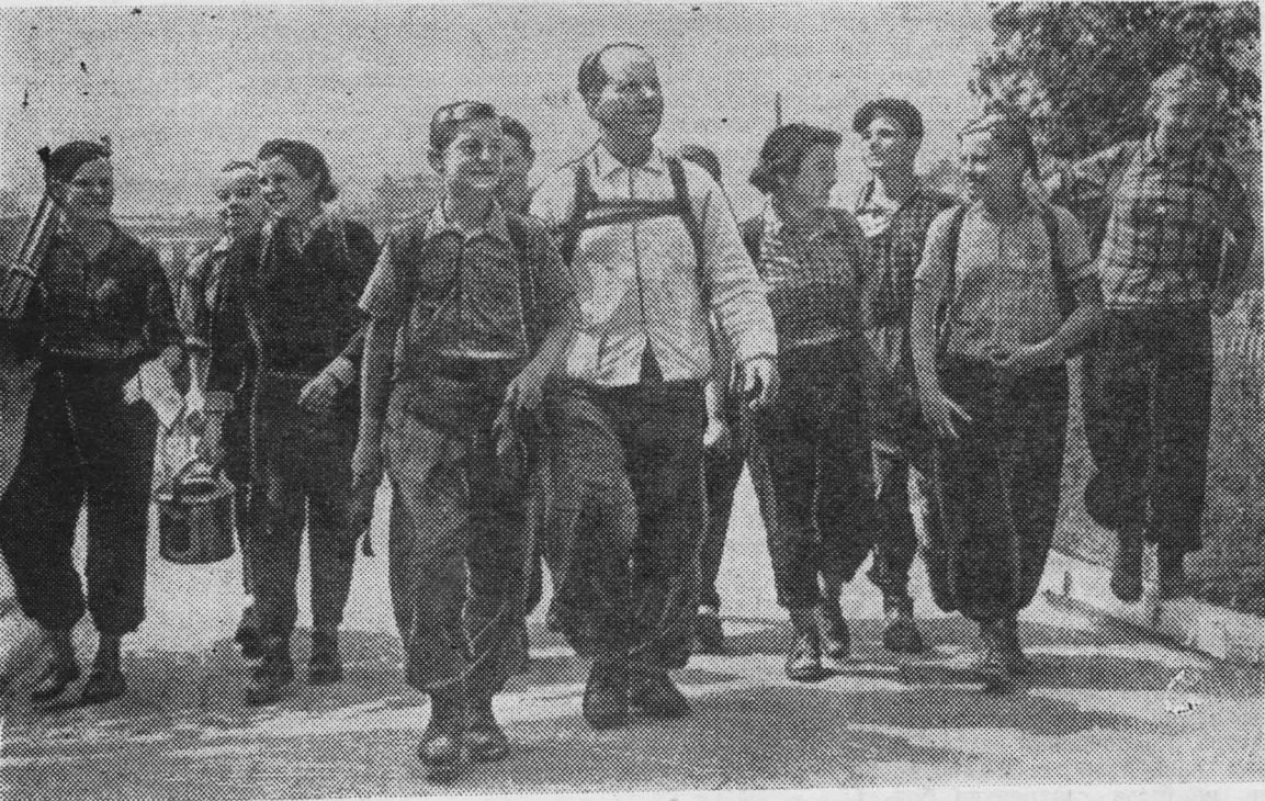
Недавно туристы Атамановской семилетней школы побывали на VII Всекузбасском слете туристов.