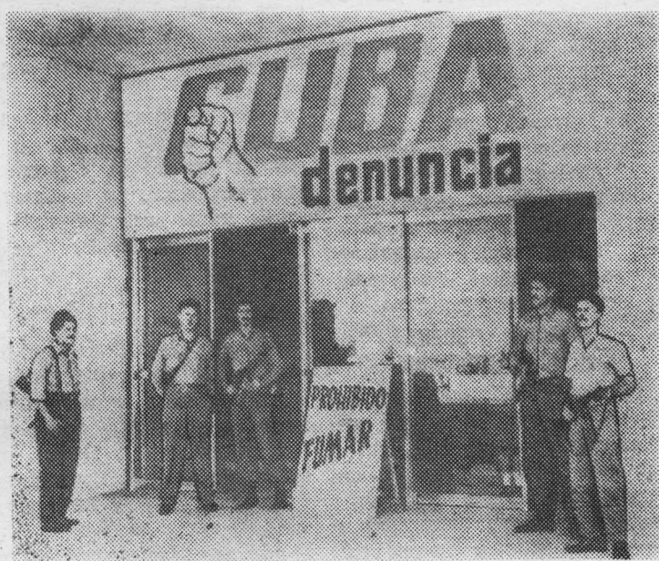
«Куба разоблачает» — так называется выставка, открытая в Гаване.

что к вечеру 22 апреля в болах было взято в плен еще 178 участников интервенции против Кубы. Среди них сыновья лидеров окупавшейся в США кубинской контрреволюции — Миро Кардона и Мануэля Антонио де Варона.