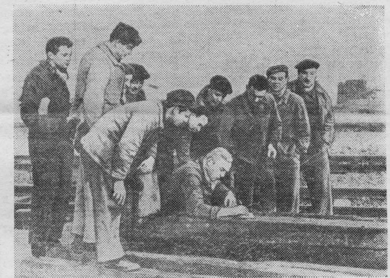
Трудящиеся Франции усиливают борьбу за немедленное прекращение войны в Алжире, продолжающейся более шести с половиной лет.

На снимке: железнодорожники Лиона проводят сбор подписей под резолюцией, требующей прекращения позорного кровопролития в Алжире.