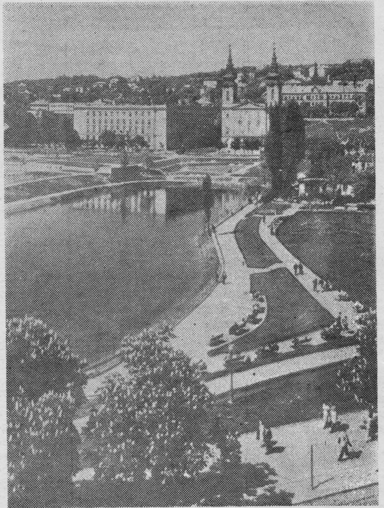
4 апреля — венгерский национальный праздник. 16 лет назад в этот день Советская Армия завершила освобождение Венгрии от фашистских захватчиков.

В заключение мне хотелось бы сказать, что было бы хорошо, очень хорошо, если бы после окончания XV сессии Генеральной Ассамблеи, которой, как известно, предстоит рассмотреть еще некоторые важные вопросы, можно было бы заявить: да, эта сессия проделала основательную работу в пользу улучшения отношений и взаимопонимания между государствами в пользу развития международного сотрудничества и укрепления мира.