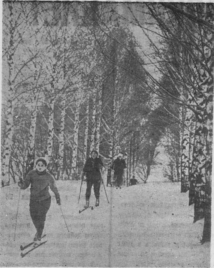
На лыжной прогулке.