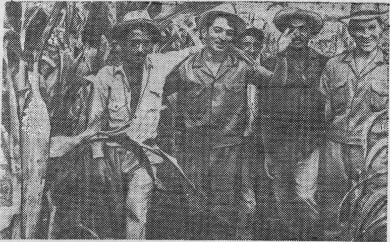
Группа молодых механизаторов и агрономов, прибывшая из СССР, работает в народном имении «Иван Родригес» (провинция Ориенте). Они рассказывают кубинским крестьянам о достижениях советских колхозов и совхозов, делятся своим опытом и знаниями. На снимке: советские и кубинские друзья.

♦ В Боливии проводится кампания солидарности с революционной Кубой. На днях в Ла-Пасе состоялась национальная конференция в поддержку Кубы, в которой приняли участие делегаты всех районов страны. Выступая перед делегатами конференции, вице-президент Хуан Лечин приветствовал кубинскую революцию.