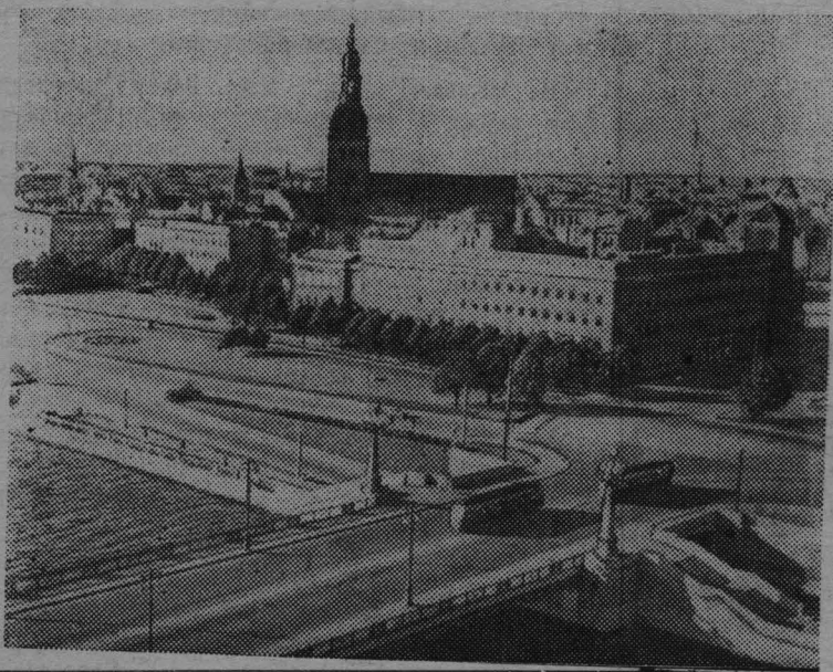
«КОЛХОЗНИК КУЗБАССА» 2 стр.