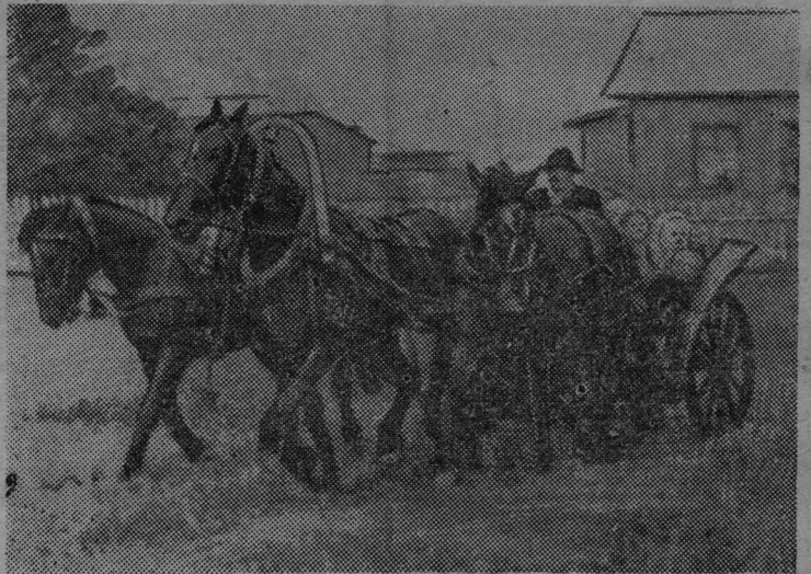
Вот мчится тройка удаляя...

И вот результат: первое место присуждено рысаку райветлечебницы Меркурий (наездник Шарабарин). 1600 метров — за 2