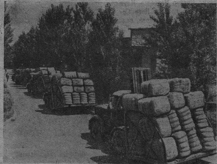
Ставропольский край. Колхозы и совхозы края ведут стрижку многомиллионного поголовья тонкорунных овец. Животноводы взяли обязательство закончить стрижку за 17 — 20 рабочих дней и сдать Родине 29 тысяч тонн высококачественной шерсти. Почти половина этого количества уже поступила на Невинномысскую шерстомойную фабрику.

В своем решении сессия наметила ценные мероприятия по ликвидации вскрытых недостатков в работе Атамановского сельсовета.