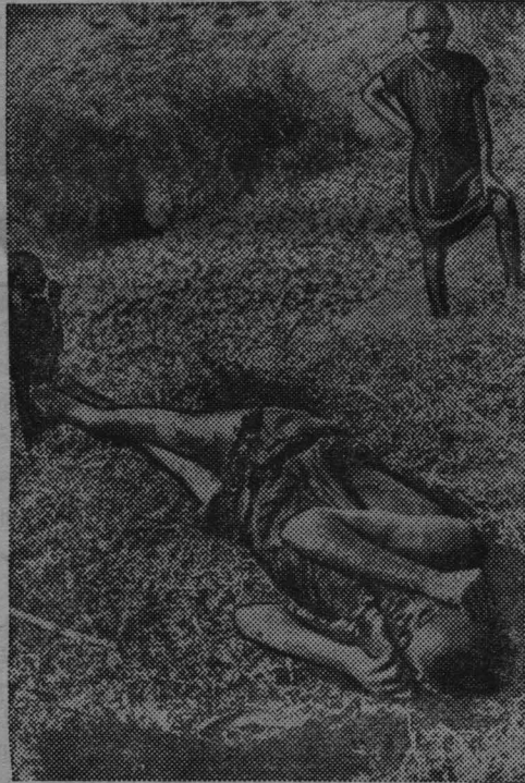
На снимке: дети бахуту, пришедшие на поле битвы. Их отец убит.

Центральная Африка. На бельгийской подопечной территории Руанда-Урунди вспыхнуло народное восстание против местных феодалов. С давних пор крепостные бахуту, которые составляют 83 процента населения территории, борются за освобождение от феодальной зависимости. Представители племени батутси составляют феодальную верхушку общества. С ее помощью колонизаторы грабят природные богатства страны, угнетая подавляющее большинство населения.