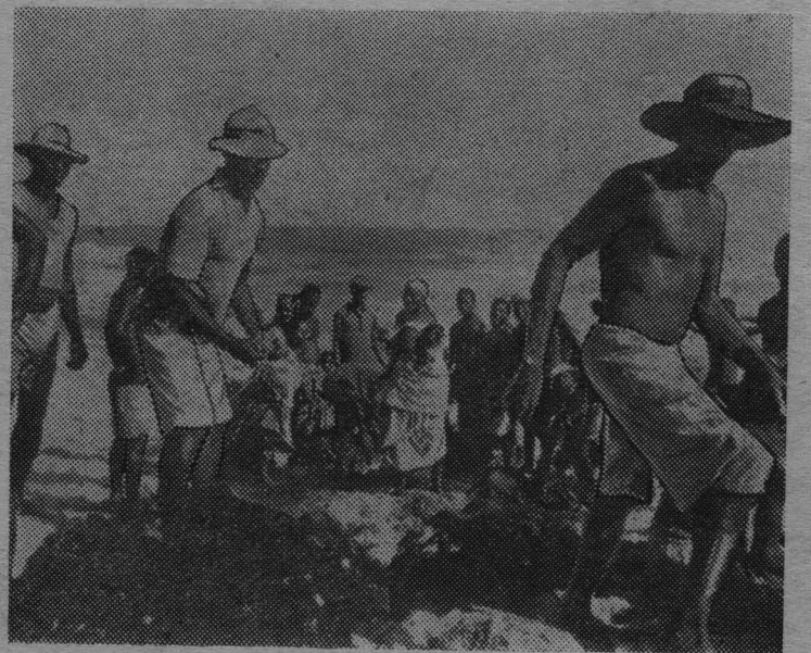
Гана. Рыбаки на побережье близ Аккры.

ко, вчера совет министров Федерации Мали принял декрет о введении чрезвычайного положения на всей территории федерации.