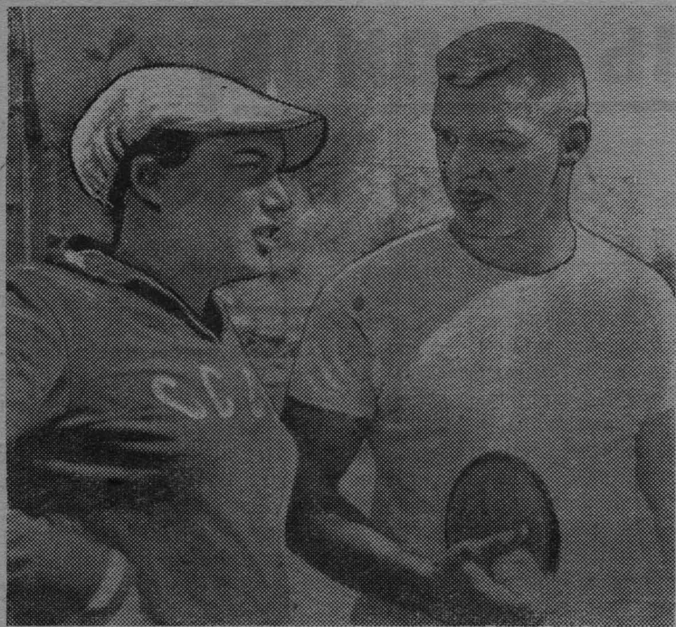
★ РИМ, Олимпийские игры.

На снимке: советская спортсменка Тамара Пресс беседует с американским дискоболем Алом Уерттером.