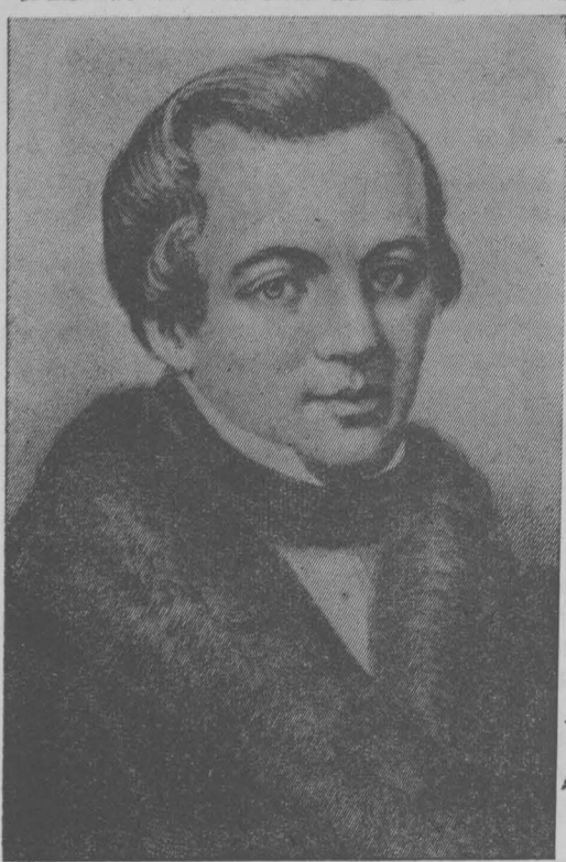
Алексей Васильевич Кольцов выдающийся русский поэт

(К 150-летию со дня рождения. Родился 15 октября 1809 г.)