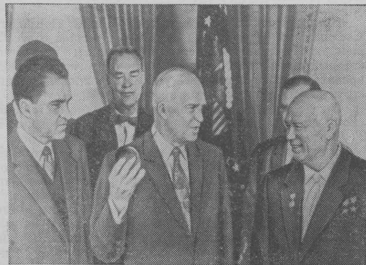
Вашингтон. Беседа в Белом доме между Председателем Совета Министров СССР Н. С. Хрущевым и Президентом США Д. Эйзенхауэром.

После приема в одном из крупнейших отелей Вашингтона