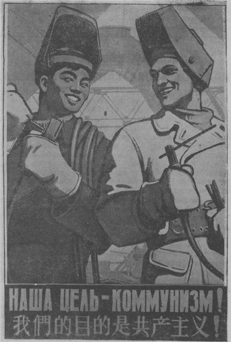
Плакат художника В. Каленского (Государственное издательство изобразительного искусства).

Уже к концу 1956 г. 120 миллионов крестьянских дворов добровольно объединились в производственные кооперативы, на базе которых позднее были созданы народные коммуны. 70 тысяч частных капиталистических предприятий