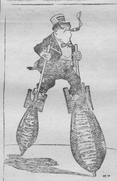
С «позиции силы» или американские ходули. Рис. Брусиловского.