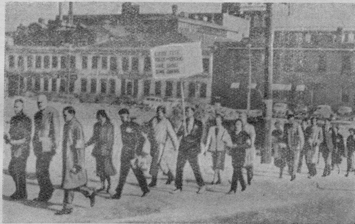
Соединенные Штаты Америки. Участники движения «Пход за мир», протестующие против испытаний атомного оружия, совершили шестидневный поход из Нью-Хейвена в Нью-Йорк к зданию ООН. По пути число участников похода непрерывно росло.

давно избран. На аэродроме Шостаковича встречали вице-президент академии «Санта Чечилия» и представители музыкальной общественности Италии.