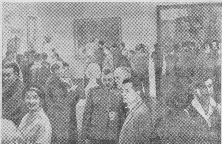
Польская Народная Республика. В Варшаве открыта выставка советского современного искусства.