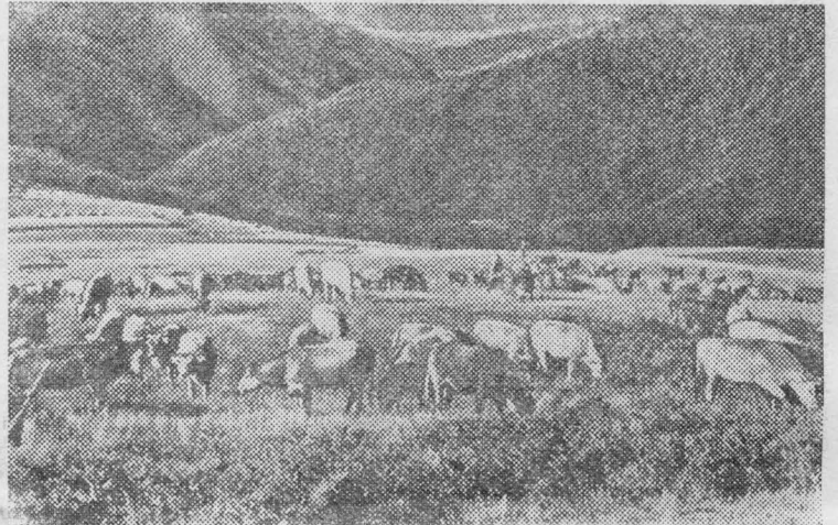
Народная Республика Болгария. На пастбище государственного земельного хозяйства имени Диню Дачева близ города Сливен.